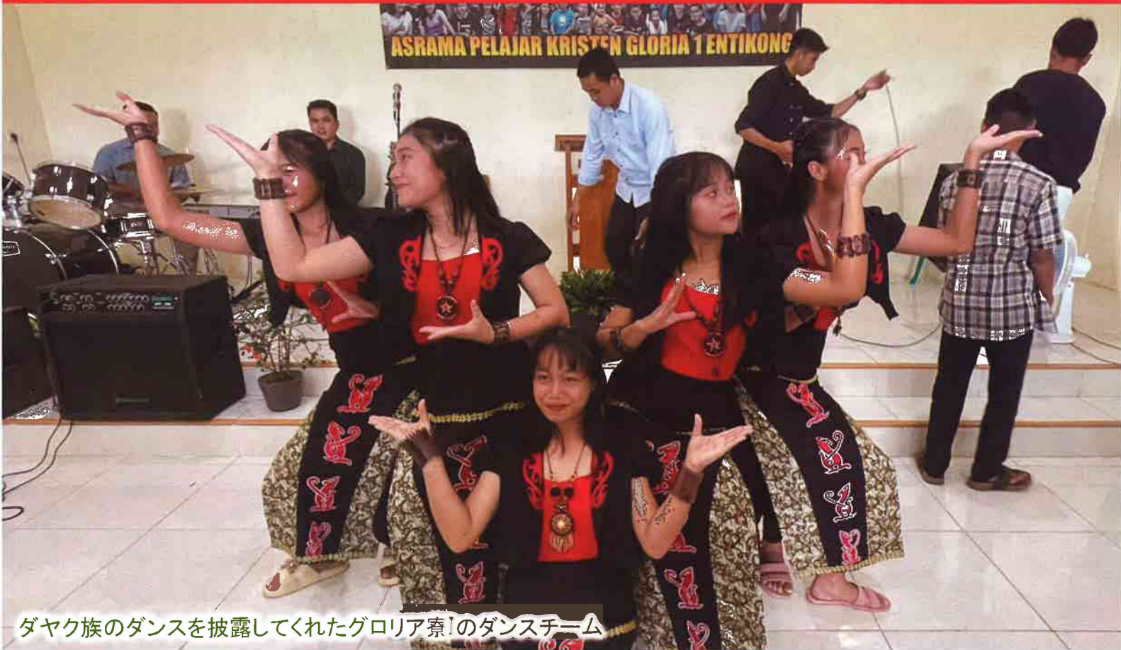
ダヤク族のダンスを披露してくれたグロリア寮のダンスチーム