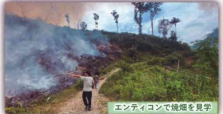
エンティコンで焼畑を見学

くれている事を知っている、温かい眼差しをした彼女でした。彼女との出会いは妻にとって何よりも励みになったようでした。インドネシアは全ての国民が宗教を持つことを義務付けられていますが、シュノーレンはほとんどの人がプロテスタントを選択しています。今回の視察でいくつかの村を訪れましたが、シュノーレンははっきりとわかるくらいに雰囲気の良い村でした。「こんな山奥にまで福音が届いている。」内側に感動を覚えました。