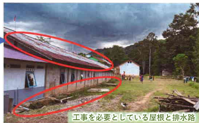
工事を必要としている屋根と排水路

◎12月27日～1月4日の異文化体験ツアー(10名)の守りと祝福のために。参加者の中高生達は海外が初めてです。グロリア寮IIで年越しキャンプファイヤー、グロリア寮Iでクリスマス集会を予定。