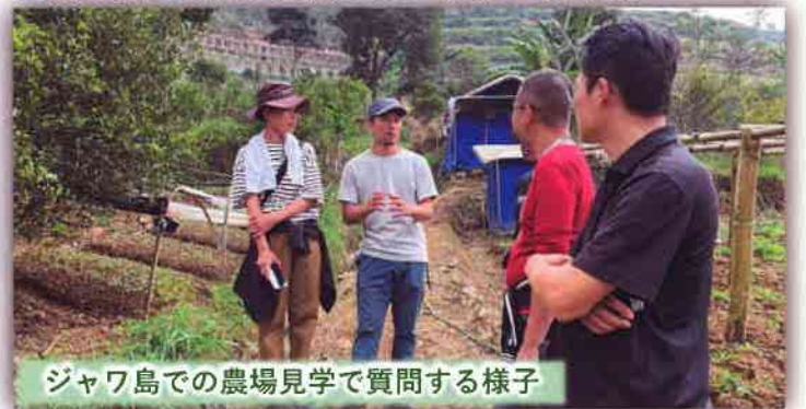
ジャワ島での農場見学で質問する様子

寮の働きは、いつも何かしらの困難や忍耐を抱えているようでした。グロリア寮IIは、学生は多いですが生活の必需品である水不足の問題を常に抱えています。グロリア寮IIは、舎監の先生も子ども達の雰囲気も素晴らしいのですが、建物の老朽化や交通の不便さの問題を抱えています。ペラカ寮は、水も豊富で建物も立派なのですが、校区や通信の事で学生が集まりにくいという問題を抱えています。それでも寮の働きは前進しています。環境が整ったから進むのではなく、問題を抱えながら前進し続けている様子でした。