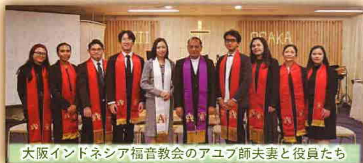
大阪インドネシア福音教会のアユブ師夫妻と役員たち

「宣教ガイド2023」(第7回日本伝道会議)の中に、次のようなことが書かれてありました。「外国語教会でも、すでにその子弟の日本化が始まっている。だからこそ、日本の教会に期待したいことは、彼らとつながる心を持つことである。…宣教協力と交わり、超教派の活動から、多文化共生のモザイクチャーチの実現を期待したい。」宣教地が玄関先にやってきている今、私たち日本の教会も“扉”を閉めたままではいけません。外国語教会との協力は、新たな宣教の“扉”を開ける一歩になると信じます。