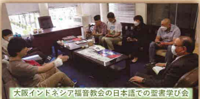
大阪インドネシア福音教会の日本語での聖書学び会

彼らはまた、宣教に非常に熱心です。日本にいるインドネシア人はもちろんのこと、イスラム圏の国から来た人々にも積極的にリーチし、伝道しています。また、日本人に対する重荷もあり、インドネシア教会で日本人が救われはじめています。インドネシア福音教会全体の教勢報告によると、2021年度717人に対して、2022年度は829人と1年間で100人以上増えています。まさに“玄関先にやってきた宣教地”へのチャレンジが実を結んでいます。