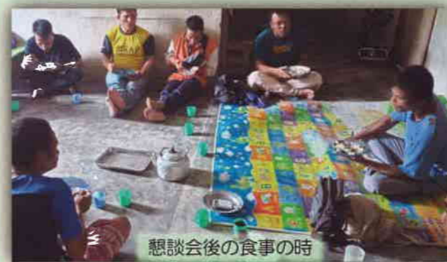
懇談会後の食事の時

保護者たちと、寮での指導、またそのプロセスについて沢山意見を交わすことができ大変嬉しかったです。最後は皆で一緒に食事をして、和やかで大変良い時でした。定期的に声を聞いていこうと思います。