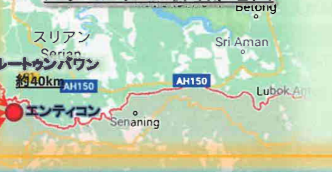
スルートウンバワン 約40km