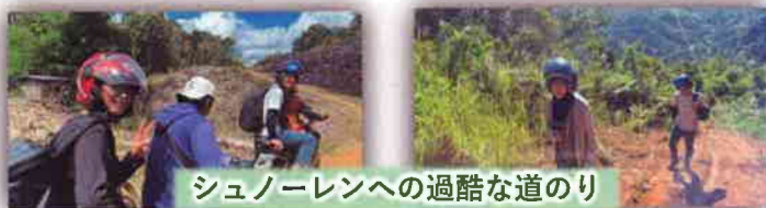
シュノーレンへの過酷な道のり

山岳地帯の村で特に印象的だったのは、コーヒー畑の視察に訪れた山の上の村、シュノーレンでした。シュノーレンには二人乗りのバイクで向かいました。事前情報では半日で行って帰って来れるはずでしたが蓋をあけてみると、炎天下の中、何度もバイクを降りて坂を登らなければならず、一日がかりの想像を超えた過酷な道中になりました。